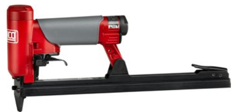
Version magasin double longueur (DL) = jusqu'à 390 agrafes