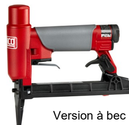
Version à bec long 50 mm